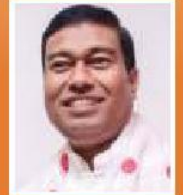
Rameswar Teli Minister of State, Food Processing Industries