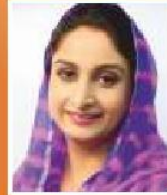
Harsimrat Kaur Badal Minister of Food Processing Industries