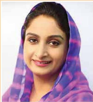
Harsimrat Kaur Badal Minister of Food Processing Industries