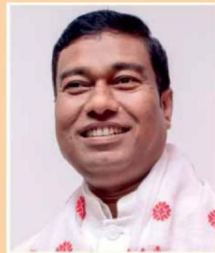
Rameswar Teli Minister of State, Food Processing Industries